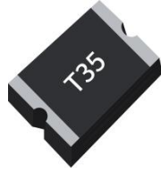
Low Loss NSML1505