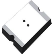
Low Loss ASML0402